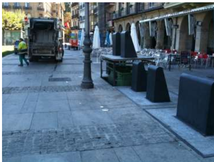
vista isola ecologica tipo interrata vista sistema a cassonetti fuori terra