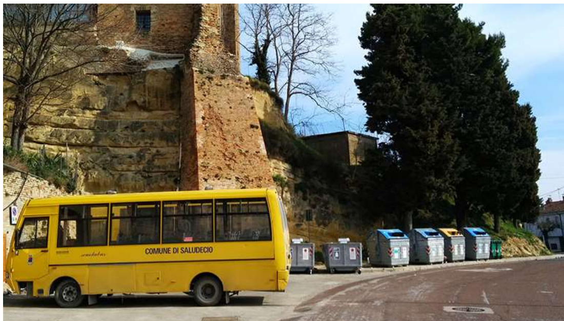
vista area isola ecologica esistente