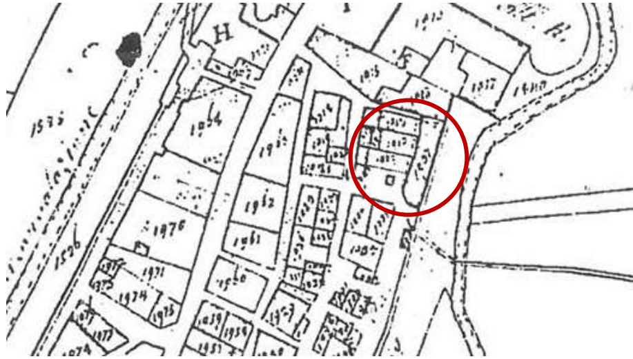
Catasto Gregoriano 1835