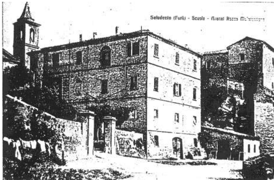
Cartolina palazzo comunale risalente al periodo della seconda guerra mondiale