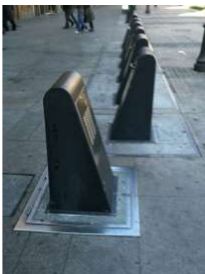
vista isola ecologica tipo interrata vista sistema a cassonetti interrati