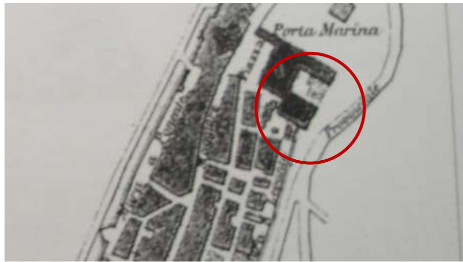
Carta Topografica Provincia di Forlì 1888