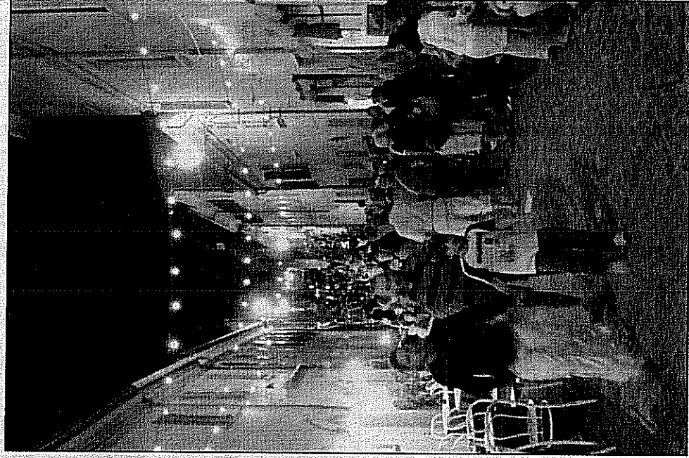
Una via del paese che torna all'Ottocento

Per i più piccoli, favole garfagnane proposte dai Korakanè, animazioni dedicate al filosofo Carlo Cattaneo e spettacoli, come "Il viaggio del capitano Nemo" presentato da Cinemusicatronica. Per le vie del centro, saranno poi allestite mostre, con esposizioni di quadri, fotografie, tarocchi, murales e documenti, riguardanti in parte Giuseppe Garibaldi. L'ingresso alle serate avrà un costo di 3 euro, gratuito per