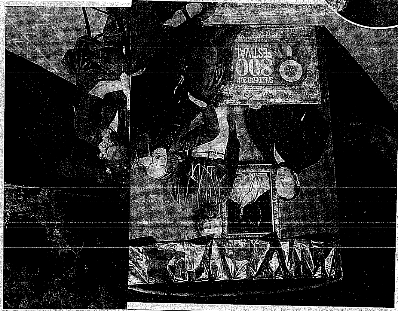
Insieme L'800 festival dell'anno scorso

Da domani a Saludecio la kermesse che celebra il diciannovesimo secolo tra rievocazioni storiche e spettacoli